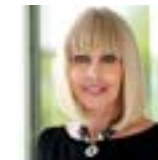
GRAŻYNA KULCZYK Businesswomen, Mecenas kultury