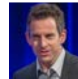
PROF. SAM HARRIS ateista, autor bestsellerów: „Przebudzenie”, „Koniec wiary”