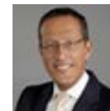
RICHARD QUEST dziennikarz CNN