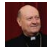
KARDYNAŁ GIANFRANCO RAVASI Przewodniczący Papieskiej Rady ds. Kultury